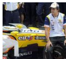
Alonso y el R28

Siete ingenieros españoles trabajan en él - 05-11-2008